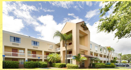
Quality Inn Miami Airport Hotel