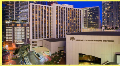
Hyatt Regency Miami