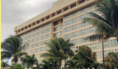
經濟標準酒店： Holiday Inn Miami West