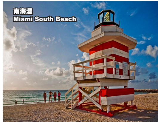
南海灘 Miami South Beach