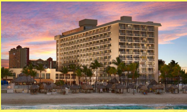
豪華商務酒店： Newport Beachside Hotel & Resort