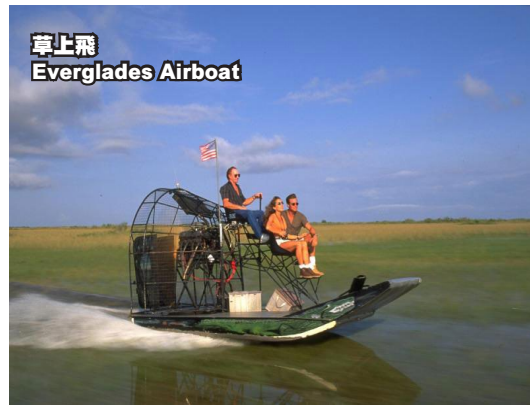
草上飛 Everglades Airboat