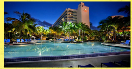
Crowne Plaza Hollywood Beach Resort