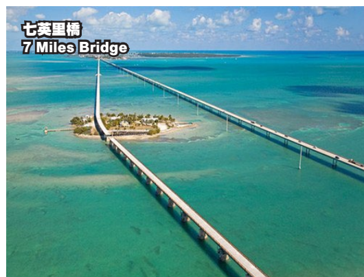
七英里橋 7 Miles Bridge