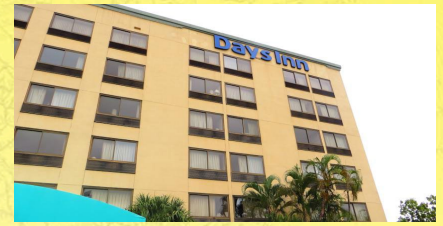
Days Inn Fort Lauderdale Hollywood/Airport South