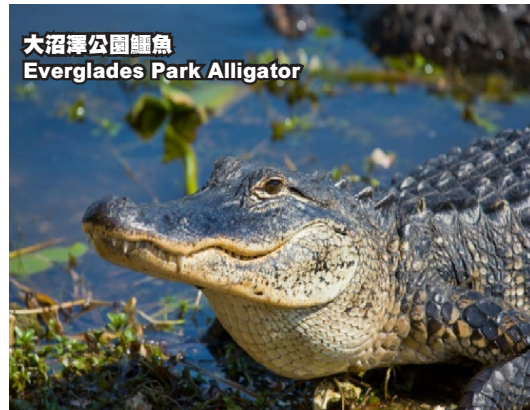
大沼澤公園鱷魚 Everglades Park Alligator